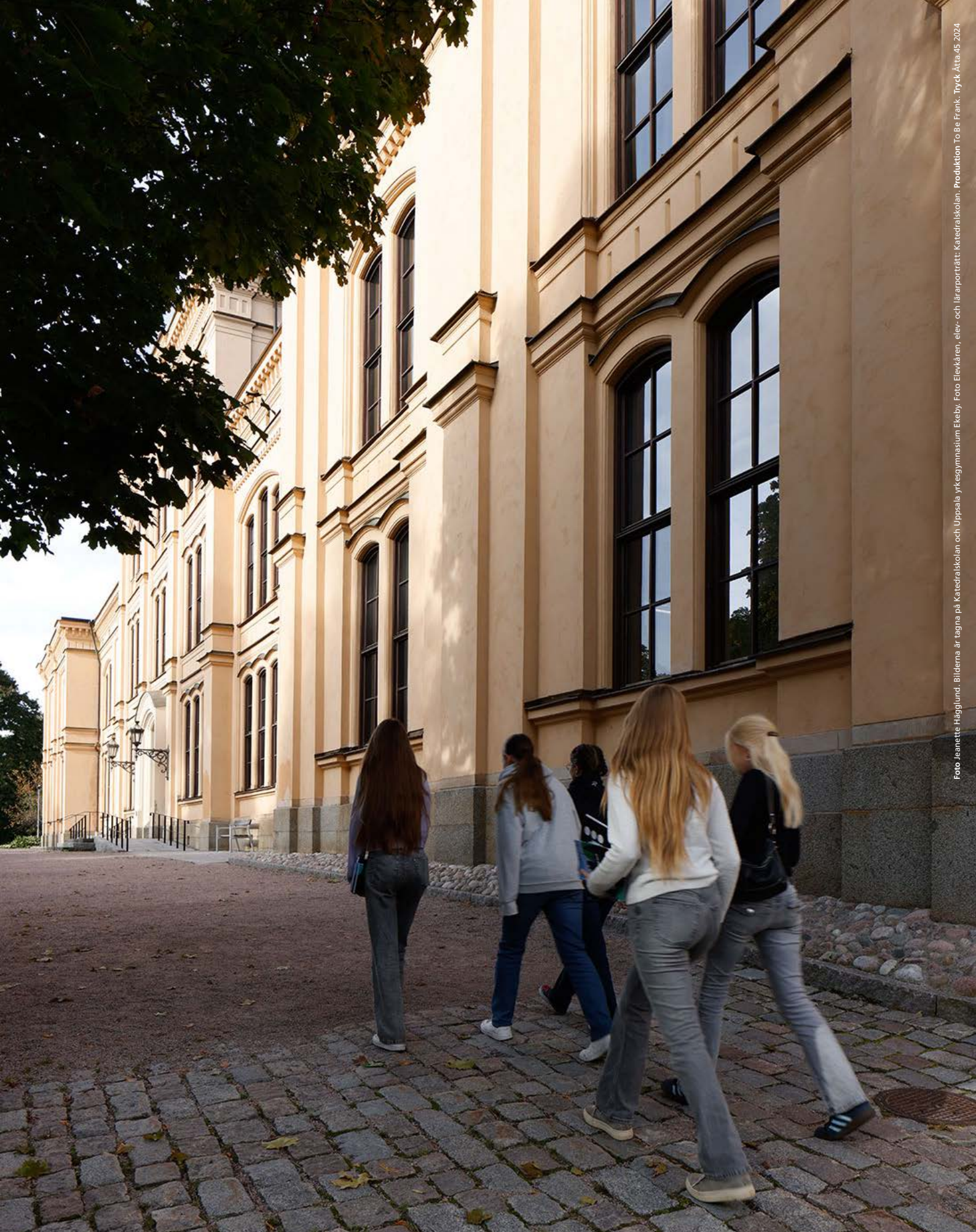
Foto Jeannette Hägglund. Bilderna är tagna på Katedralskolan och Uppsala yrkessymnasium Ekeby. Foto Elevkåren, elev- och lärarporträtt. Katedralskolan. Produktion To Be Frank. Tryck Åta. 05 2024